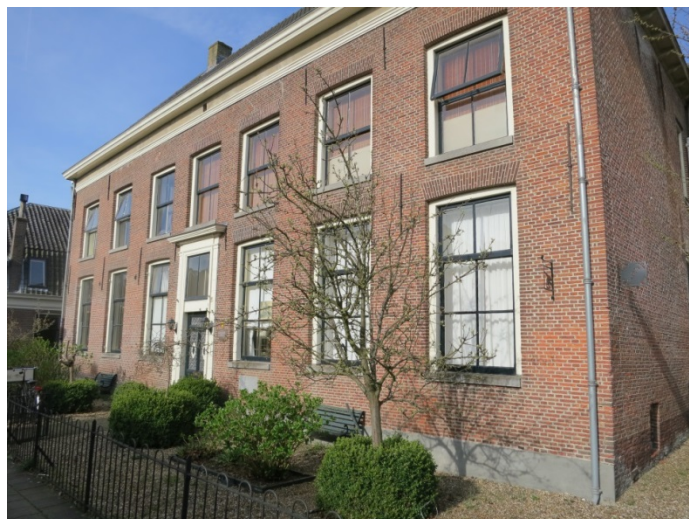
Geboortehuis van Christiaan Eijkman

In de kerk is in 1909 ook een bronzen gedenkplaat geplaatst door nakomelingen van Arendt van Curler. Dat was een andere Nijkerker die furore maakte in de Nieuwe Wereld. Zijn verhaal vertellen we straks op een andere plek in Nijkerk.